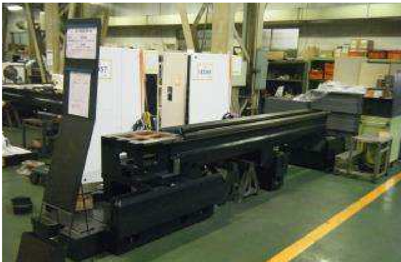
OPEN機 リプレース機 M5 2500U S/N 162365 2003年製 SmoothC 主軸Φ104 2200min-1 8D+6B 完成 11月末予定 (チャックなし)ベッド研磨済