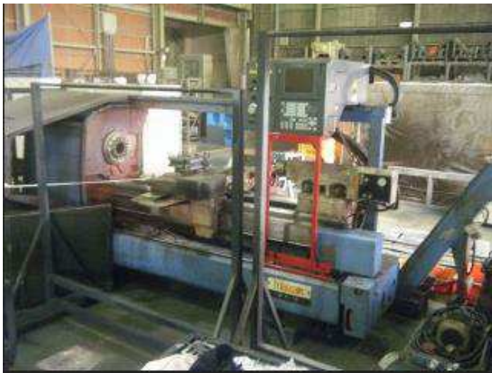
OPEN機 リプレース機 M5 1500U S/N 151958 1995年製 SmoothC \Phi 104 主軸 2200min-1 4QCのみ(8B無し) 未着手(チャックなし)