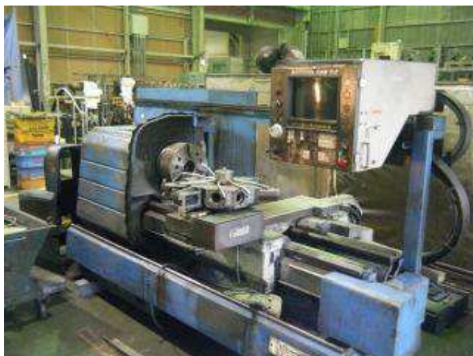
OPEN機 リプレース機 M5 1000C S/N 72826 1988年製 SmoothC \Phi 104 主軸 2200min-1 8Bのみ(4QC無し) 未着手(チャックなし)