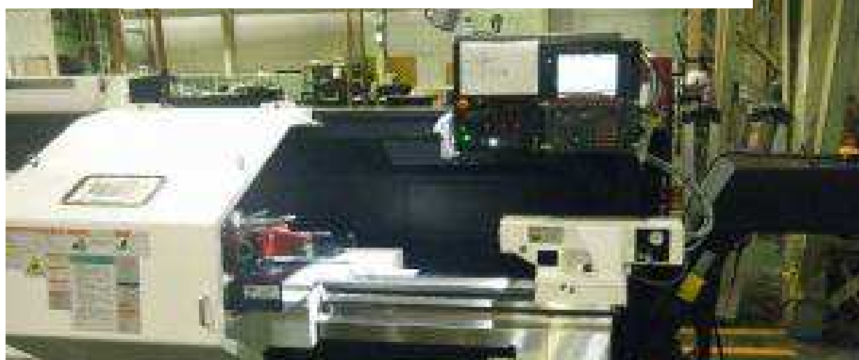
M4 1500U S/N 110775 1994年製 SmoothC 2200min-1 4QC/8B ツールアイ チップコンベア 完成 7月上旬予定 8/18納期