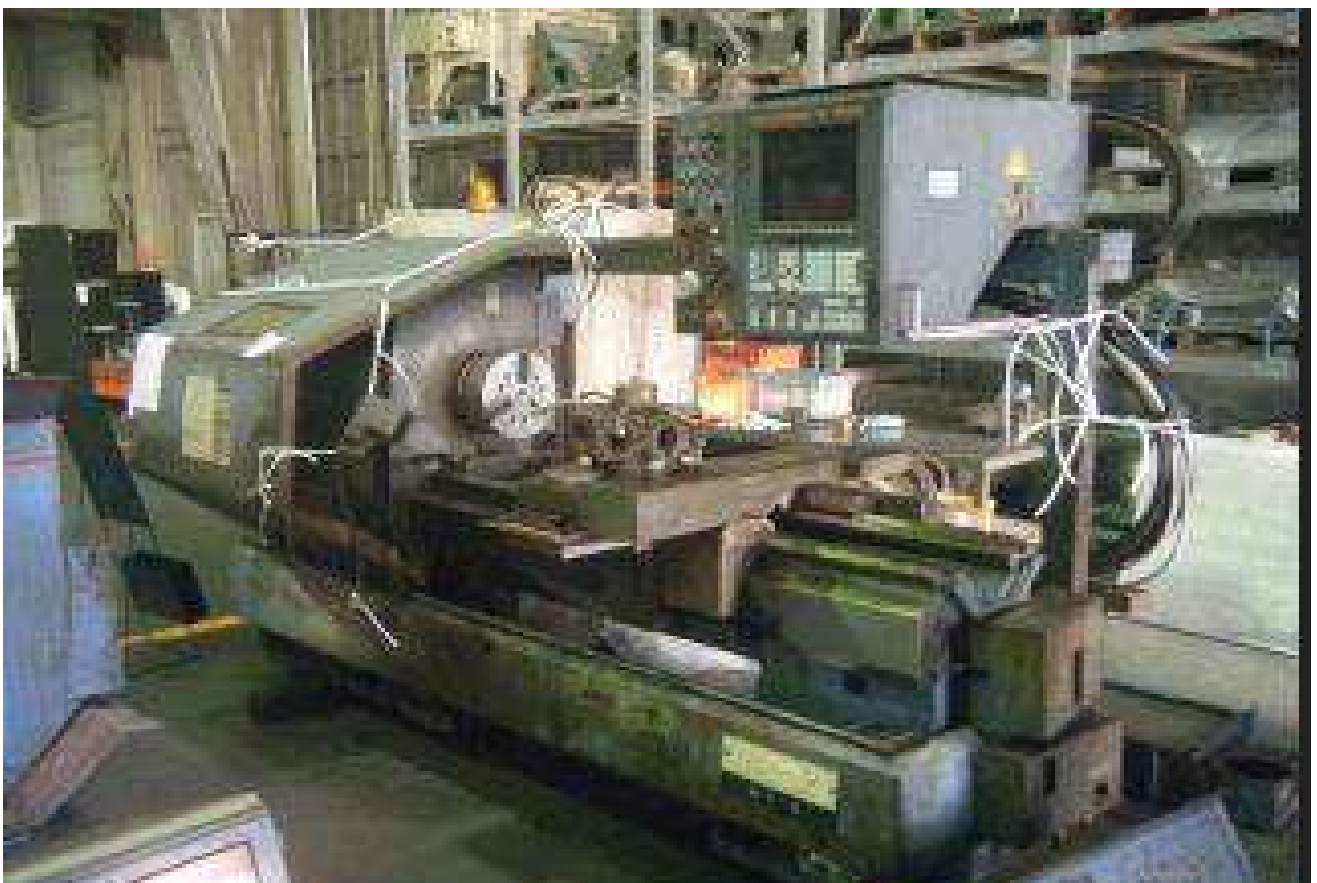
OPEN機 リプレース機 M4 1000C S/N 119222 1995年製 SmoothC 2200min-1 8Bのみ 未着手(チャックなし)