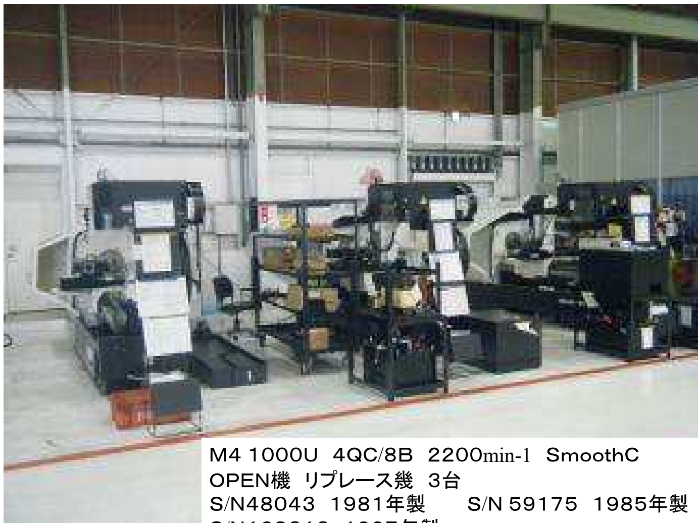
M4 1000U 4QC/8B 2200min-1 SmoothC OPEN機 リプレース機 3台 S/N48043 1981年製 S/N 59175 1985年製 S/N128313 1997年製