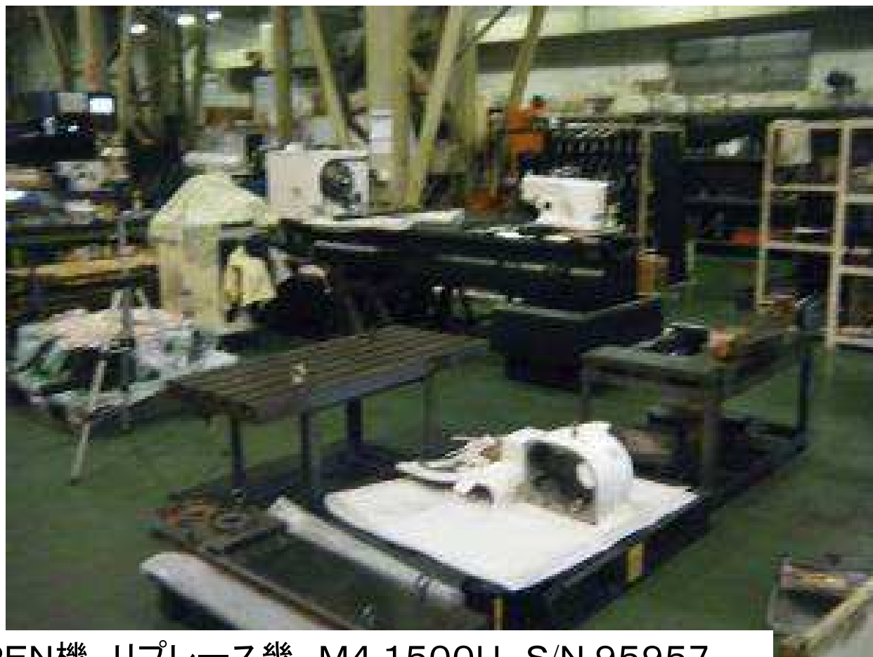
OPEN機 リプレース幾 M4 1500U S/N 95957 1990年製 SmoothC 2200min-1 8D+6B 9月末完成予定 ベッド研磨完了