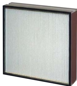
内蔵されているHEPAフィルタ