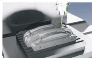
コダマコーポレーション マシンシミュレーション 一体型 CAD/CAM TopSolid' Cam 7

CAD/CAM/CAEシステムインテグレーション KODAMA CORPORATION