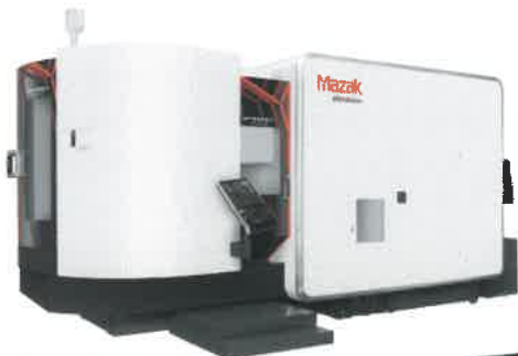
ヤマザキマザック 複合加工機 INTEGREX i-500V/5