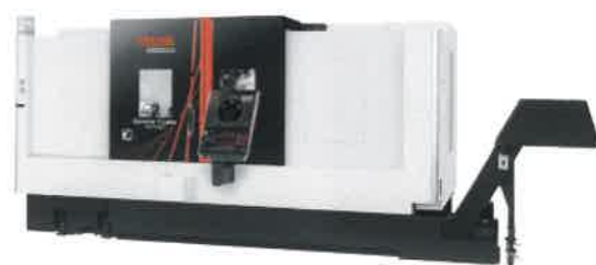
ヤマザキマザック CNC 旋盤 QUICK TURN 300