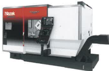
ヤマザキマザック 複合加工機 INTEGREX i-200H