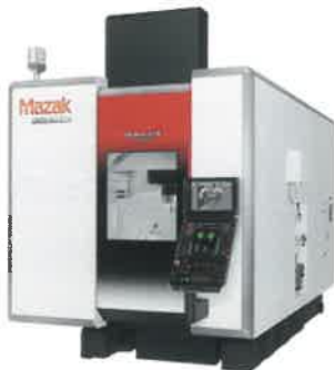
ヤマザキマザック 5軸加工機 VARIAXIS i-700T