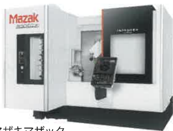
ヤマザキマザック 複合加工機 INTEGREX j-200