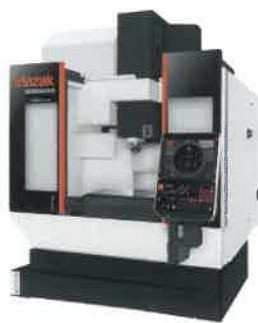
ヤマザキマザック 立形マシニングセンタ VCN-430A