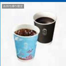
お持ち帰り限定 MACHI caféドリンク(S) (1杯)