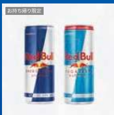
お持ち帰り限定 レッドブル 250ml 2種いずれか1つ