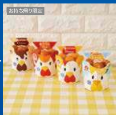
お持ち帰り限定 からあげクン 各種いずれか1つ