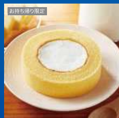
お持ち帰り限定 ウチカフェプレミアムロールケーキ

都合により商品が変更になる可能性があります。商品受け取り方法は裏面をご覧ください。スマートフォン以外の端末ではご利用いただけません。