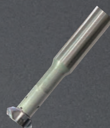
刃先交換式 C面取りカッター