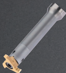
刃先交換式 溝入れカッター