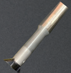
刃先交換式 アリ溝カッター