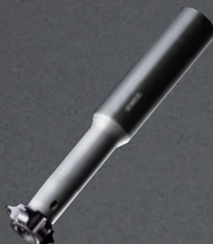
刃先交換式 R面取りカッター