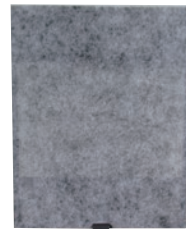
【HSE302用抗菌フィルター】 ※黒いフィルターは付いておりません。