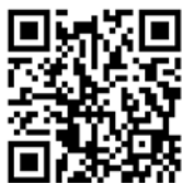
本体正面のQRコード からも応募できます。

※HSE302でお申し込みされた方へは抗菌フィルターを1つプレゼントいたします。