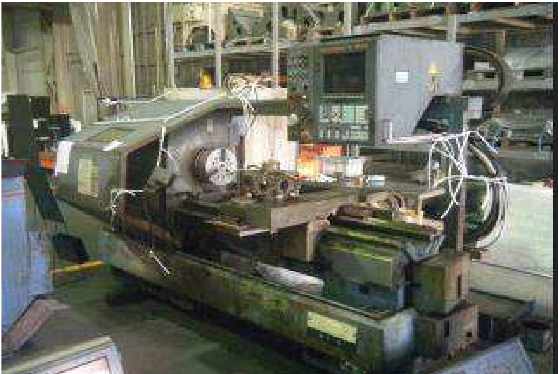
OPEN機 リプレース機 M4 1000C S/N 119222 1995年製 SmoothC 2200min-1 8Bのみ 未着手(チャックなし)