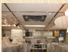
化粧パネル 取り外し