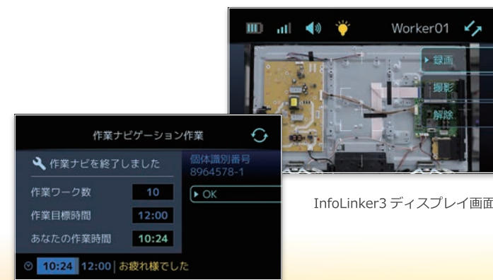
InfoLinker3 ディスプレイ画面