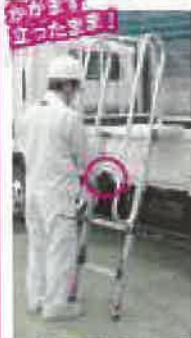
DXF-U14TEA 上部操作イメージ