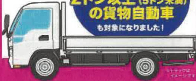
※トラックはイメージです