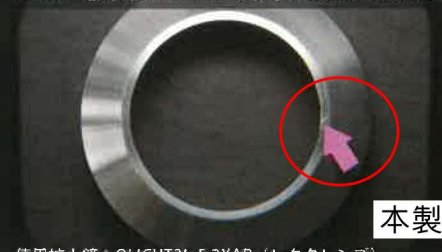
使用拡大鏡：OLIGHT3L-F 2XAR（レクタレンズ）

画像は「円形レンズにリング照明を装備した製品（画像1）」と、「角形レンズに片方向照明を装備した製品（画像2）」の見え方の違いを比較したものです。