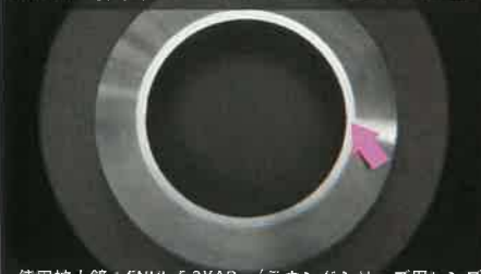
使用拡大鏡：ENVL-F 2XAR（ラウンドシリーズ用レンズ）