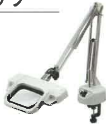
OLIGHT3L-F フリーアーム式(クランプ取付式) 製品寸法(アーム全長): 905mm 製品重量: 2.5kg(レンズ含まず)