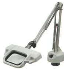
OLIGHT3L-FD フリーアーム式(デスクホルダー固定式) 製品寸法(アーム全長): 940mm 製品重量: 2.4kg(レンズ含まず)