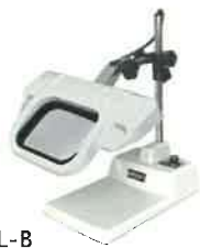
OLIGHT3L-B テーブルスタンド式 製品寸法(WxHxD): 185x380x300mm 製品重量: 2.3kg(レンズ含まず)